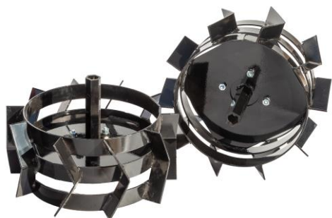
Set roți metalice 350 mm sau 400 mm cu adaptoare de fixare