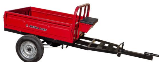
Remorcă 400 kg sau 500 kg