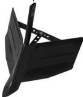
Accesoriu deschis rigole reglabil